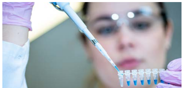
Επιστήμονες που εκτελεί έρευνα βλαστοκυττάρων για θεραπεία καρκίνου

Άδειες ευρεσιτεχνίας σε φαρμακευτικές εταιρείες.)